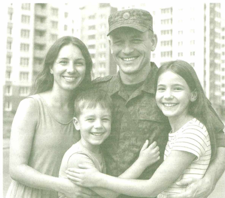
Югра безусловный лидер по финансовой поддержке при заключении контракта на воинскую службу.

«Все участники СВО имеют право приостановить исполнительные производства. Однако приостановить – не означает прекратить! Кроме того, такая мера не распространяется на требования по алиментным обязательствам, а также по обязательствам о возмещении вреда жизни или здоровью граждан (в том числе по обязательствам о возмещении вреда в связи со смертью кормильца), а также на требования имущественного характера, возникшие в результате совершения коррупционных преступлений», – уточнили в УФССП по Югре.