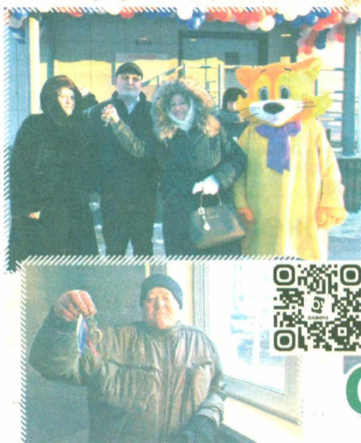
Фото с дополненной реальностью. Сканируйте QR-код и смотрите видео.