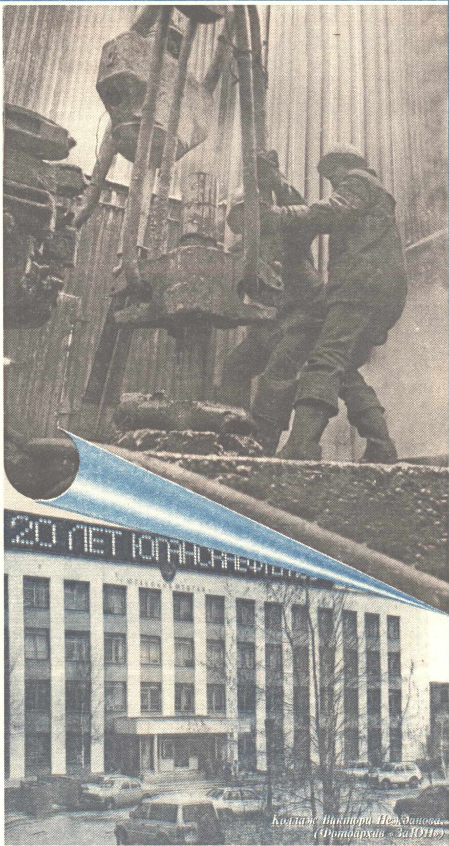
Коллаж Виктора Нежданова.