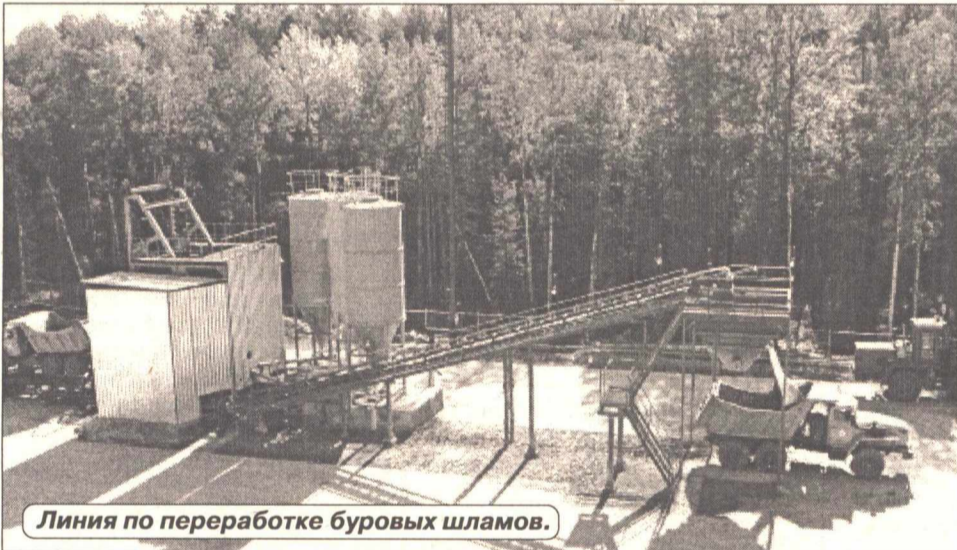
Линия по переработке буровых шламов.