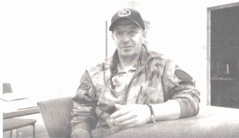
И мне, и моей семье помогли на 200 процентов – уверен и сейчас, когда уезжаю в третий раз, поддержка будет огромная: точно знаю, что не бросаю. Югра своих не бросает.