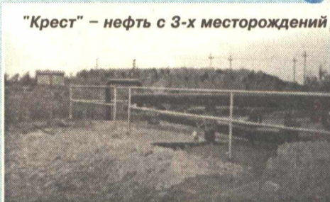
"Крест" – нефть с 3-х месторождений