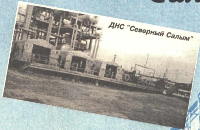
ДНС "Северный Салым"