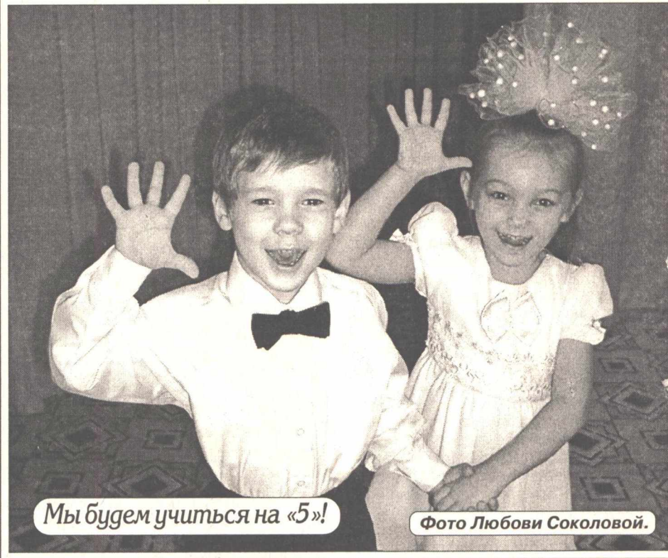
Мы будем учиться на «5»!

БОЛЕЕ 15 ОЧКОВ. Вы вполне справляетесь со своими родительскими обязанностями. И тем не менее, не удастся ли еще кое-что немного улучшить?