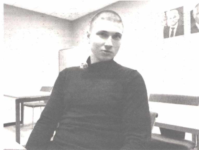
Али на передовую идет не за деньгами, а за боевым опытом и, прежде всего, с огромным желанием помочь родной российской армии разбить врага.