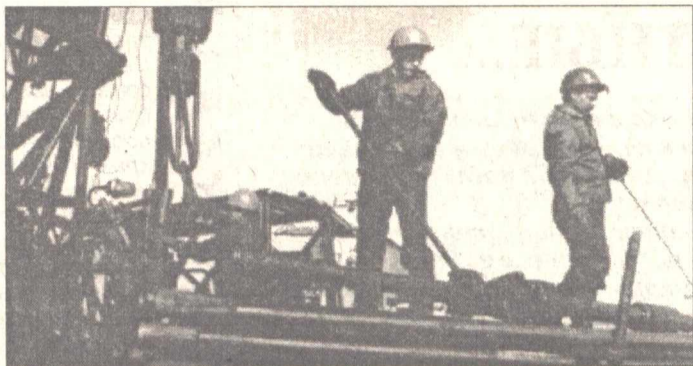
Добыча нефти по ОАО ЮНГ за март 1997 года (в тысячах тонн)

Выполнено 1061 геологическое мероприятие с эффектом около 280 тыс. тонн нефти, при первоначальных расчетах 765 мероприятий с эффектом 164 тыс. тонн. В рамках бюджета закупается материально-технические ресурсы. Большое внимание уделяется долгосрочной безаварийной работе нефтедобывающих установок. Ужесточен контроль за соблюдением тех-