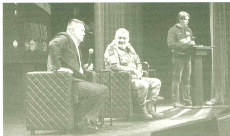
Проект «Наставник Z» был запущен летом 2024 года в 13 регионах.