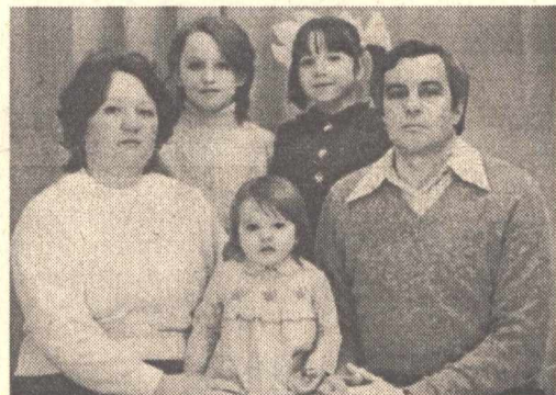
ходов. А доходы в семье не безразмерные.

— Да, конечно. Получаем мы с мужем немного. Я — две, да муж, машинист «Азин-маш», — две с половиной тысячи рублей. Продукты покупаем на базаре, подешевле. На одежду деньги копим, и ездим за ней на екатеринбургский вещевой рынок на своей машине. И в отпуск, и на дачу — выручает наш старенький «жигуленок».