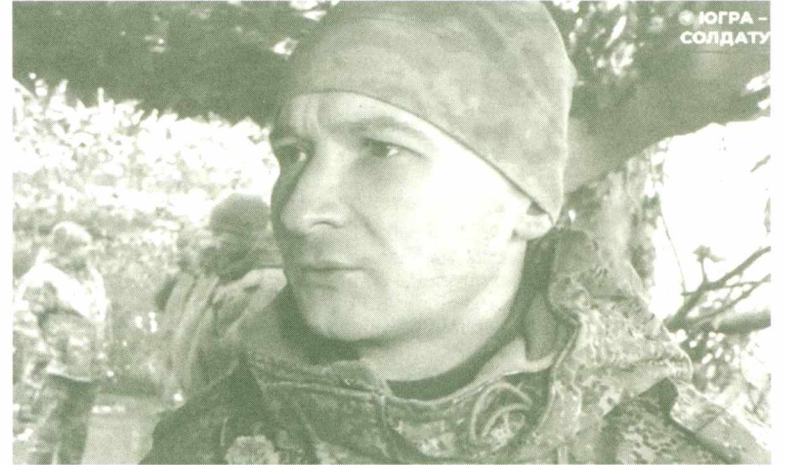
Родные стены и письма близких для «Рус» – не слова, а реальная поддержка, которую ценят все в подразделении.

– Признаюсь, морально я оказался к этому не совсем готов. Это совсем другая война, не Афган и не Чечня. Страх смерти лежит в основе инстинкта самосохранения, поэтому избавиться от него полностью невозможно. Через это проходит каждый боец. Стараешься действовать на морально-волевых качествах, пересилить себя, взять в руки. Ты понимаешь, что выжить можно, действуя собранно и хладнокровно. В