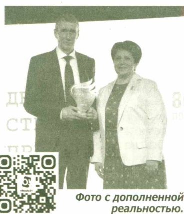
Фото с дополненной реальностью.

Премия поддерживается Владимиром Путиным, организатор – ВАРМСУ при поддержке администрации президента РФ.