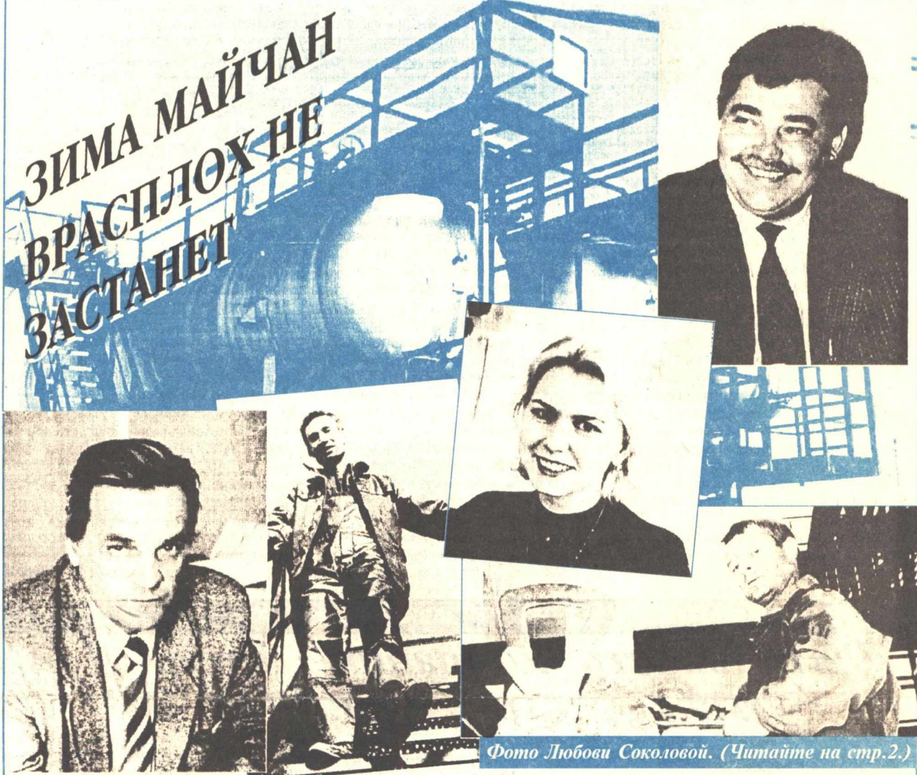
(Читайте на стр.2.)

А.Лоторев, депутат Государственной Думы по 222-му Ханты-Мансийскому избирательному округу.