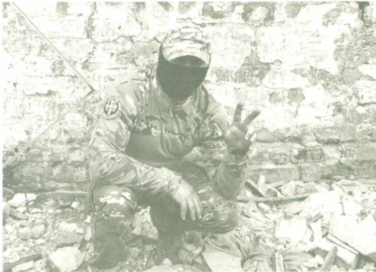
Мы, русские и сербы, – одна семья, братья по славянской крови.

Служить так, чтобы не было стыдно ни самому, ни людям, которые доверили тебе защиту Родины. Именно об этом говорят те, кто уходит сегодня по контракту в зону специальной военной операции из Югры.