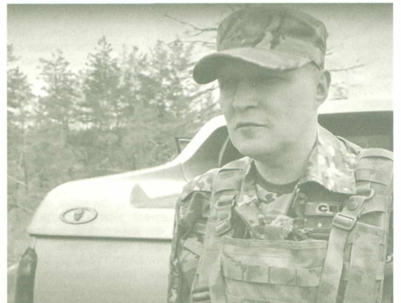
«Север» считает, что Югра находится на передовых позициях по поддержке своих военнослужащих, участвующих в СВО.

Он родом с Донбасса, из Северодонецка. В 1994 году окончил военное училище, служил в Заплярье, потом, уйдя на воинскую пенсию в 2007 году, работал в Югре.