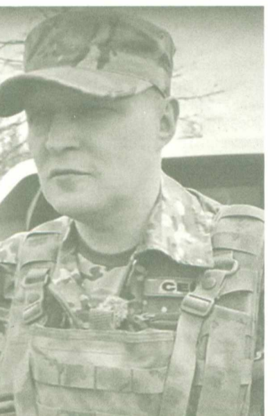
Отметим, заявки от ребят обрабатываются в информационной системе АИС «Гумпомощь». Это платформа, на которой каждый боец может оставить заявку и каждый югорчанин может оказать посильную поддержку землякам на передовой.

– Спасибо большое губернатору, именно по нашим заявкам мы получаем то дорогостоящее оборудование, которое нам необходимо. Такая помощь очень нас выручает, – отметил офицер.