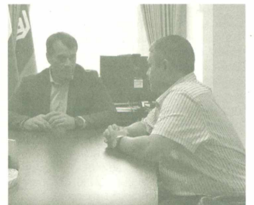
Валерий планирует вступить в Ассоциацию ветеранов СВО.

Напомним, в Югре выстроена эффективная система по медицинской и социальной реабилитации бойцов, получивших боевые травмы.