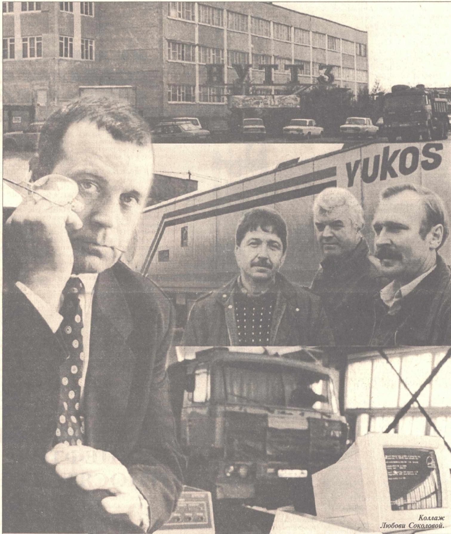
Коллаж Любови Соколовой.