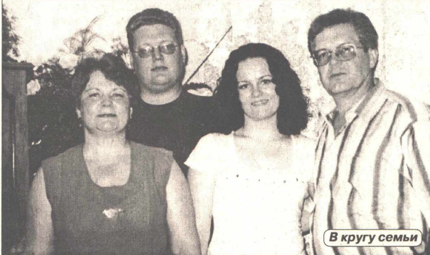
В кругу семьи

вой, надежный. Иначе нельзя — сюда поступает только оперативная информация, и от диспетчера зависит многое.