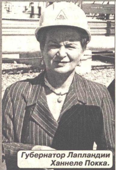
Губернатор Лапландии Ханнеле Покка.

Еженедельная газета ОАО Юганскнефтегаз Выходит с 17 ноября 1978 г.