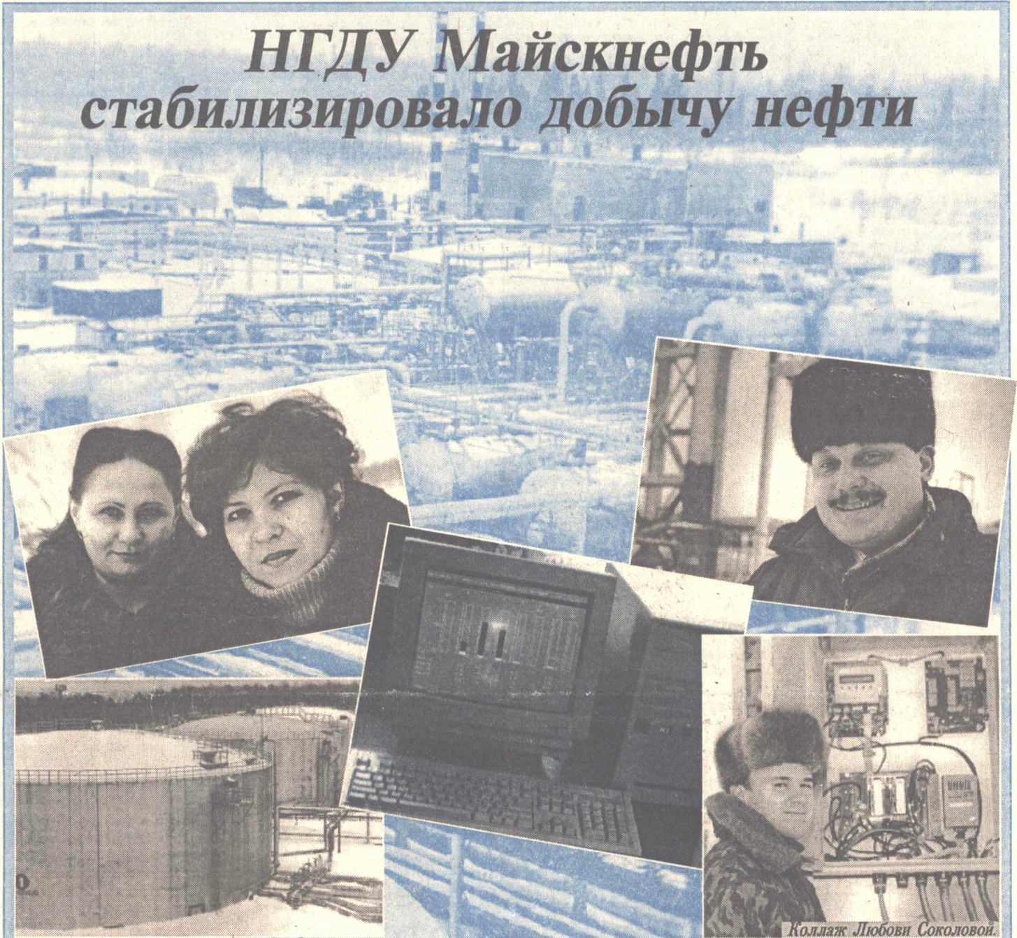
Коллаж Любови Соколовой.

Одно из наиболее молодых и перспективных управлений акционерного общества сегодня тоже переживает не лучшие времена. И все же на фоне неурядиц, вызванных экономической нестабильностью в обществе, оно выглядит не только не хуже других, но где-то даже во многом и лучше. Журналистская бригада побывала в "сердце" НГДУ – на центральном пункте сбора (ЦПС), где вершится дальнейшая судьба добытой на месторождениях нефти. Как все дороги ведут в Рим, так и все нефтепроводы ведут на ЦПС – эта истина стара, как мир.