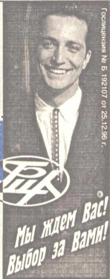
Гос. лицензия № 5 192107 от 25.12.96 г.

Центр корреспондентского обучения и информационных проектов (ЦКОиИП)