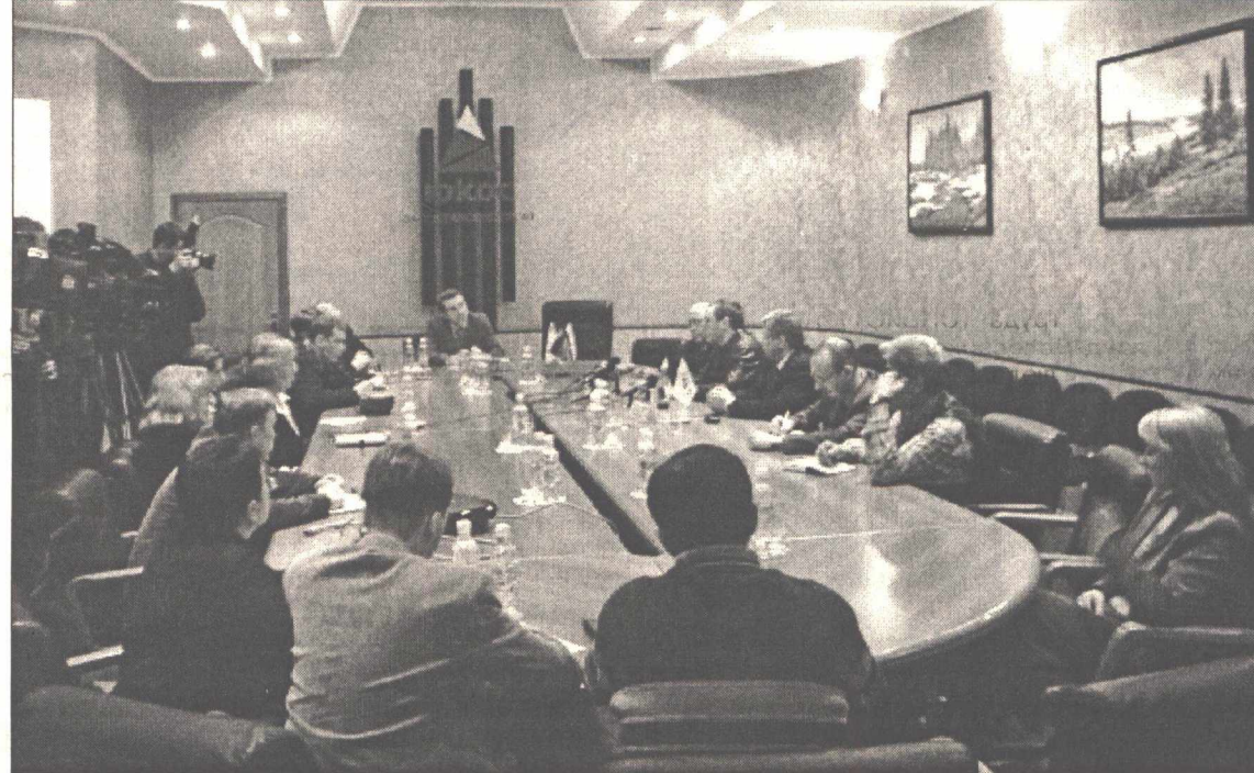
Фото Любови Соколовой.

рализации НГДУ, поправил журналистов управляющий. Из пяти действующих подразделений по добыче создается три. Это НГДУ Мамонтовнефть, куда волеется коллектив Юганскнефти, НГДУ Правдинскнефть, в которое войдет коллектив Дирекции по разработке Приобского месторождения, и, наконец, в прежнем составе остается НГДУ Майскнефть. Менять статус и состав этого управления сегодня нецелесообразно. Коллективу предстоит очень серьезная работа по освоению Угутско-Киньяминской группы месторождений. Буквально за два года предстоит нарастить здесь добычу от двух до семи миллионов тонн. Масштабные шаги будут предприняты в бурении и развитии инфраструктуры.