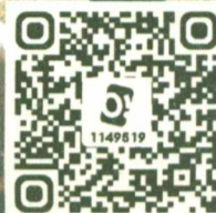
Фото с дополненной реальностью

Участники праздника получили незабываемые эмоции, заряд бодрости и хорошего настроения. Хотите почувствовать настроение – сканируйте QR-код и смотрите видео.