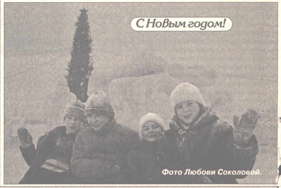
С Новым годом!